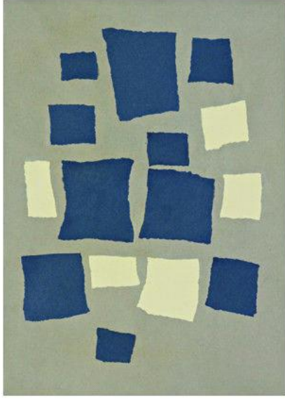
Resim 3: Hans Arp, Uyum, Kolaj, 1917