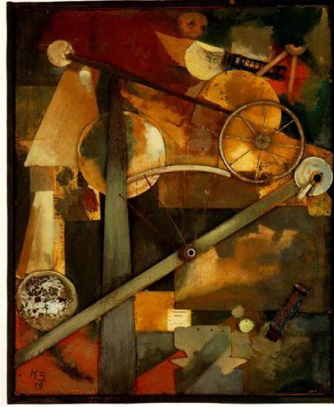
Resim 4: Kurt Schwitters, Soylu Kadınlar, Asemblaj, 1919

Dada, altında ezildiği bu değerlerin karşısına “hiç” ile çıkmıştı. Bu yüzden, söylemlerini öncelikle toplumun sanatsal ve kültürel değerleri üzerine odaklamışlardı. Dadaistler, insanın insana yaptığı zalimlik yüzünden sanatı ve toplumu ikiyüzlü ve sığ buluyorlar ve özellikle geçmişini idealize eden referansları yok etme gayretleri içinde, savaşın anlamsızlığını vurgulayarak bilinçli ya da bilinçdışı sanat değerleri yaratıyorlardı.