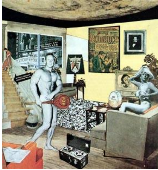
Resim 5: Raoul Haussmann, Mekanik Kafa, 1920 Evlerini Bu Denli İlginç Kılan Tam Olarak Ne? 1956