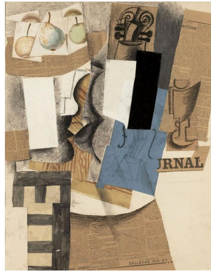
Resim 1: George Braque Meyve Tabakası, Kolaj, 1912