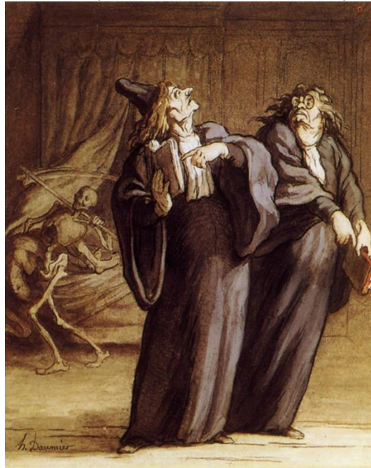
Onore Domije, Dva doktora i smrt , 1869. Honoré Daumier, Les Deux medecines et la Mort , c. 1869.

Onore Domije, koga su nazivali „Mikelandelo karikature,” bio je slikar, štampar, skulptor i karikaturista. Tokom svog radnog veka načinio je više od 4000 litografija koje su poznate po specifičnoj satiri u kojima su glavni likovi bili političari. U svojim karikaturama naglašavao je političku situaciju svog vremena, oslikavajući korupciju u sudstvu, greške birokratije i nekompetentnost vlade. Zbog oštrog pera bio je i u zatvoru.