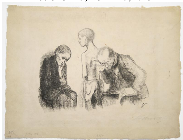
Kete Kolvic, Kod doktora , 1920. Käthe Kollwitz, „Beim Arzt“ , 1920.

Kete Kolvic jedna je od najznačajnijih nemačkih umetnica dvadesetog veka, izuzetna žena koja je stvorila vanvremenska umetnička dela u uslovima teškog života i oskudice. Njena dela reflektuju socijalne uslove tog doba i tokom 1920-tih godina. Ona je stvorila seriju slika koja se tiču rata, siromaštva, života radničke klase i života običnih žena. Njen suprug je bio lekar u siromašnom delu Berlina koji je nudio besplatno lečenje siromašnima, tako da je Kete Kolvic imala prilike da se svakodnevno sreće sa gradskom sirotinjom i seljacima, njihovim patnjama, bolestima i strahovima. Svakodnevna životna iskustva su direktno uticala na njen rad, koji je prikazivao očaj miliona tokom perioda depresije, masovne nezaposlenosti i nezadržive inflacije. Imala je urođen osećaj za socijalnu nepravdu i saosećanje sa patnjama siromašnih.