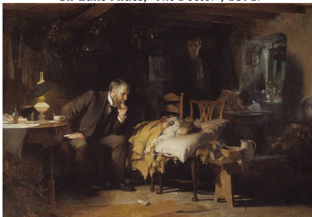
Luke Fildes, Doktor , 1891. Sir Luke Fildes, "The Doctor", 1891.

Ser Henri Tejt je 1890. godine od umetnika Luke Fildsa naručio sliku po njegovom nahođenju. Umetnik je pri stvaranju ovog dela imao na umu tragičan događaj iz sopstvenog života – smrt svoga sina u uzrastu od godinu dana. Bez obzira na tragediju, Fildes je bio impresioniran predanošću i zalaganjem doktora koga je tada imao prilike da gleda očima oca bolesnog deteta. Ali slika o kojoj je reč prikazuje „doktora tog vremena“, kroz lik doktora prikazuje samu suštinu lekarske profesije, a ne neku konkretnu ličnost [8].