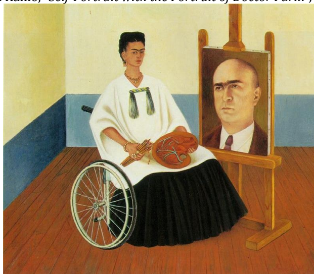
Frida Kalo, Autoportret sa portretom doktora Farila , 1951. Frida Kahlo, "Self-Portrait with the Portrait of Doctor Farill", 1951.

Doktor Huan Faril je operisao Fridu Kalo 1951. godine 7 puta pošto se njena bolest značajno pogoršala. Po delimičnom oporavku, koji je bio u tom stepenu da može da slika (mada je Frida često slikala i u bolničkom krevetu, koristeći specijalno konstruisane stalke za to), stvoreno je ovo delo. Slika je bila posvećena doktoru Farilu.