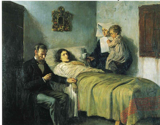
Pikaso, Nauka i milosrđe , 1897. Pablo Picasso, „ Science and Charity “, 1897.

Pikaso je ovu sliku načinio kada je imao 15 godina i ona odlično pokazuje njegov ogroman talenat koji će dominirati u umetnosti 20. veka. Zadivljuje perfektna tehnika koju je osvojio u ovom ranom uzrastu.