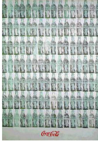
Görsel 4: Andy Warhol 1962, Tuval üzerine yağlıboya, 209,6 cm × 144,8 cm, Whitney Amerikan Sanatı Müzesi, New York City.

Warhol gibi sanatçıların işlerinin ciddiye alınmasını desteklemek amacıyla küratör ve sanat eleştirmeni olan Lawrence Alloway şöyle demiştir; “Biz bir çok entelektüelin karşı çıktığı ticari kültür standardını bir gerçeklik olarak kabul ettik ve onu ayrıntılarıyla tartışarak hevesle tükettik” (Farthing, 2014: 485). Alloway’un söyleminden yorumla Pop Sanatçıların, Dada sanatçıları gibi içinde buldukları ortama, ekonomik, politik, toplumsal ve felsefik herhangi bir karşı koyuşta bulunmak yerine içinde bulunduğu dinamiklerle uyum içinde oldukları çıkar. Warhol kendi sözleriyle bu tespiti onaylar “Resimlerimi neden böyle yapıyorum? Çünkü bir tür makine olmak istiyorum. Ne yaparsam yapayım, makineleşmiş bir halde yapıyorum ve yapmak istediğim de zaten bu. ( ... ) Sıkıcı şeyler hoşuma gidiyor” (Antmen, 2009: 166).