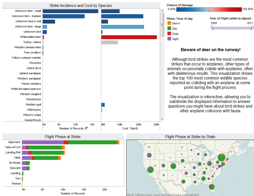
Рис. 3. Приклад панелі, створеної в Tableau для відповіді на питання «Які представники фауни визивають поломку літаків?»

Кожний студент мав оцінити трьох однокурсників обов'язково, а при бажанні ще декілька. Кожне додаткове оцінювання супроводжувалося емоційно окрашеною фразою, кожного разу іншою, наприклад «Great dedication!» або «Super duper!».