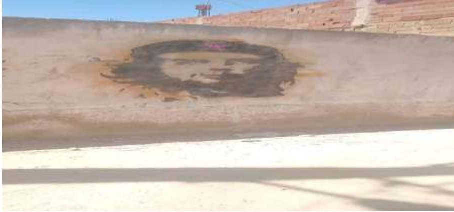
صورة رقم 01: تشي غيفارا