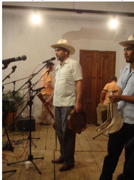
Figura 5. Presentación de grupo mono blanco, solo de pandero y quijada.

El marimbol: instrumento de origen africano que consiste en una caja de madera con lengüetas metálicas que se pulsan con los dedos y que también hace las veces de bajo. Fue introducido en la música jarocho a mediados de los años noventa del siglo pasado (Huidobro 1995).