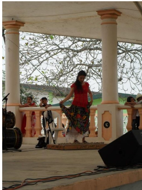
Figura 4. Uso de la tarima como percusión, bailadora del grupo Mono Blanco

El pandero: instrumento de percusión, con una membrana de piel fijado a un bastidor de madera con muescas, entre las cuales se fijan pequeños discos de hojalata. Se presume su origen africano, aunque en España se utilizó en la música popular mucho antes de los primeros viajes a América. En Tlacotalpan el pandero presenta forma octagonal, no circular. Originalmente, su uso estaba restringido al tiempo de Navidad y se utilizaba para acompañar cantos de "pascuas" y villancicos. Posteriormente, en Tlacotalpan, el uso del pandero se extendió a cualquier época del año. En cambio, en la