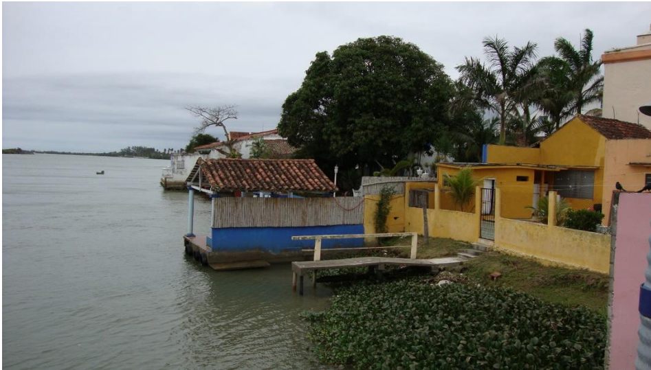
Figura 1. Orilla del río Papaloapán, Tlacotalpán, Veracruz

Este territorio no solo incluye un cancionero de sones con estilos musicales variados, integra también una cultura gastronómica, un calendario de fiestas seculares y religiosas, un conjunto de valores y formas de proceder, técnicas agrícolas y artesanales, prácticas medicinales, un repertorio de códigos, lenguas, mitos, creencias, costumbres y tradiciones (Córdova et al. 2010). Además, en este espacio geográfico se encuentran algunos de los municipios con la mayor diversidad biológica registrada en el estado, tanto por extensión como por las características de la vegetación, entre los que se pueden mencionar Alvarado, Catemaco, Minatitlán y San Andrés Tuxtla (Márquez y Márquez 2009). Cada uno de los contrastes culturales y ambientales presentes en estas zonas hacen que el son jarocho tenga diferentes matices, que lo hacen una música rica y variada.