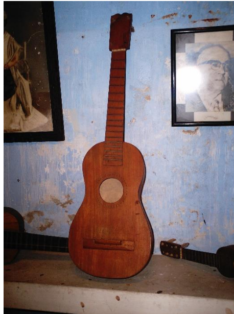
Figura 3. Jarana antigua en museo de Tlacotalpan, Veracruz

El requinto: se le llama también “guitarra jabalina” o “guitarra de son”. Es idéntico a la jarana en cuanto a los materiales, forma y construcción, pero tiene de cuatro a cinco cuerdas. Se fabrica en diversos diseños y, al menos, en cuatro tamaños distintos; éstos son, de grave a agudo: “guitarra cuarta”, “requinto jarocho”, “medio requinto” y “requinto primero”. Su función es llevar la melodía y el ritmo. Este instrumento comienza los sones a través de una breve introducción, por lo que guía al resto de los músicos y bailadores, establece la pieza musical que se tocará, su inicio, la secuencia de los sones, la velocidad, la cadencia y la tonalidad. Su ejecución se lleva a cabo punteando las cuerdas con un plectro de madera, plástico, o hueso; pero el más común es el elaborado de cuerno de toro (Huidobro 1995; Ivanov 2013; Córdova et al. 2010), también llamado “espiga”. Aunque hay otros instrumentos, la jarana y el requinto son la base instrumental del son jarocho. Los tamaños y la diversidad de diseños son infinitos. Tanto la guitarra de son como la amplia gama de jaranas derivan directamente de las guitarras traídas de España (Córdova et al. 2010).