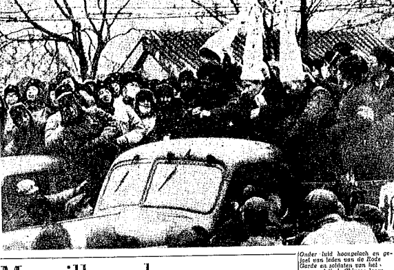
Onder: In de haven van de Rotterdamse Waterweg wordt de eerste lading van de Rotterdamse Waterweg vervoerd. De lading wordt vervoerd door de Rotterdamse Waterweg.