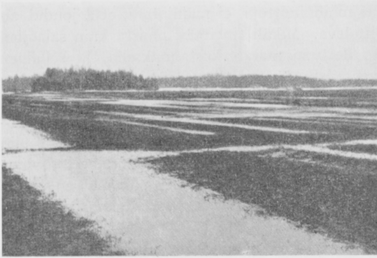
Kuva 2. Äskettäin salaojitettu aitosavipelto, jossa vielä vanhojen sarkojen kupuruus on näkyvissä. Keväällä lumen sulamisessa vapautunut vesi ei ehdi kyllin nopeasti tunkeutua tiiviin pintakerroksen läpi, vaan kerääntyy ojanotkelmiin. Tällaiset notkelmat olisi täytettävä, mutta silloin häviää ruokamulta keskisaralta.