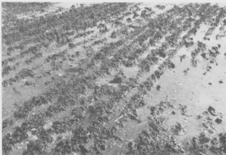
Kuva 3. Tasoitetulla aitosavimaalla runsaan vedentulon aikana voivat pintavedet aiheuttaa liettymistä salaojituksesta huolimatta.

merkiksi Hollannissa tasaisilla tiiviillä mailla jopa 8 m:iin. Tavallisessa tiiliputkiojituksessa tällainen johtaisi meillä kustannusten kohoamiseen nykyisestään vielä lähes kaksinkertaiseksi. Sensijaan yhdistetyssä sora- ja tiiliputkiojituksessa ojamäärää hehtaarilla voidaan nykyisestään huomattavasti lisätä kustannusten samalla pienetessä. Jos lisäksi soraosat sijoitetaan vanhoihin sarkaojiin, voidaan jossain määrin vähentää ruokamullan hukkaantumista vanhoihin ojiin, kun maanpinta salaojituksen yhteydessä tasoitetaan.