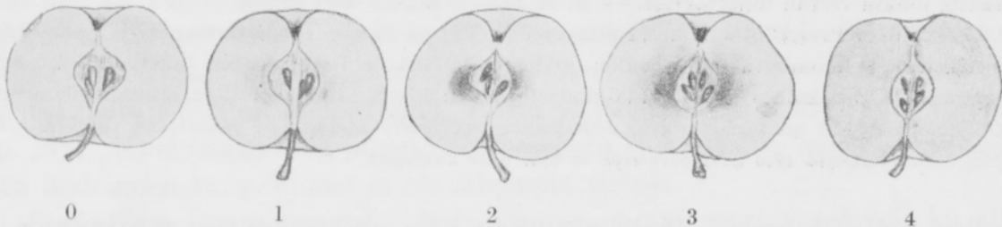
Fig. 1. The classification of brownheart-stage in table 2.