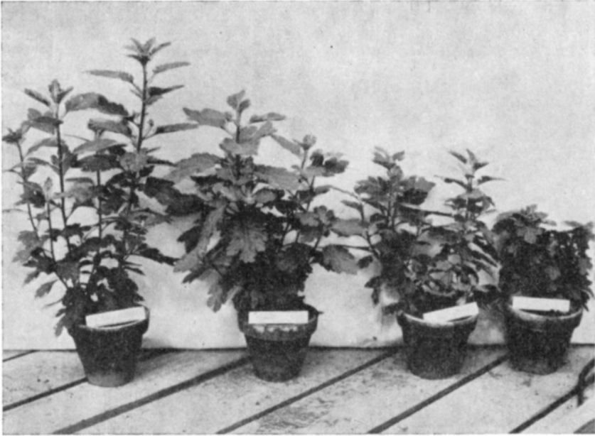
Kuva 1. Lyhyessä päivässä kasvaneita krysanteemeja 11. 8. 1961. Käsittelyt vasemmalta alkaen: kontrolli, CCC, Phosfon D, Amo 1618.

Fig. 1. Short day treated chrysanthemums 11. 8. 1961. Treatments from left: check, CCC, Phosfon D, Amo 1618.