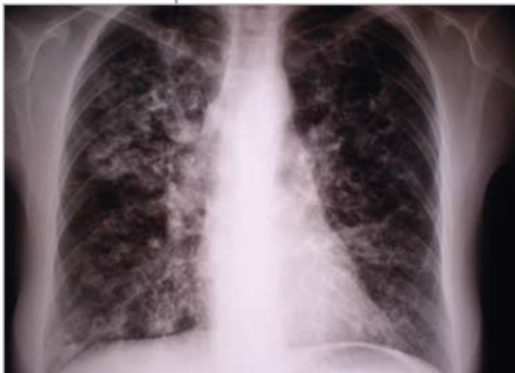
Figura 1 Rx torace: diffuse, estese, voluminose bronchiectasie con pareti ispessite e interessamento flogistico del parenchima polmonare peribronchiectasico