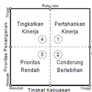
Gambar 3. Pembagian kuadran Importance Performance Analysis .

IPA menggabungkan pengukuran faktor tingkat kepentingan dan tingkat kepuasan dalam grafik dua dimensi yang memudahkan penjelasan data dan mendapatkan usulan praktis. Interpretasi grafik IPA sangat mudah, dimana grafik IPA dibagi menjadi empat buah kuadran berdasarkan hasil pengukuran sebagaimana terlihat pada Gambar 3.