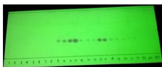
Gambar 2. Kromatogram hasil KKG

Diperoleh padatan pasta berwarna kuning pucat. Padatan ini kemudian dipisahkan menggunakan kromatografi kolom gravitasi (KKG) untuk mendapatkan senyawa murni. Berdasarkan hasil KKG (Gambar 2), diperoleh hanya satu fraksi utama yaitu fraksi 9-22. Dari fraksi tersebut diperoleh produk padatan berwarna putih kekuningan dengan perolehan rendamen 47,20%; titik leleh 68-69 °C.