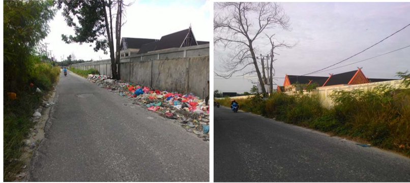
Gambar 2. Perbandingan Kondisi Sampah di Jl. Bangau Sakti Tahun 2018 (Kiri) dan 2019 (Kanan)