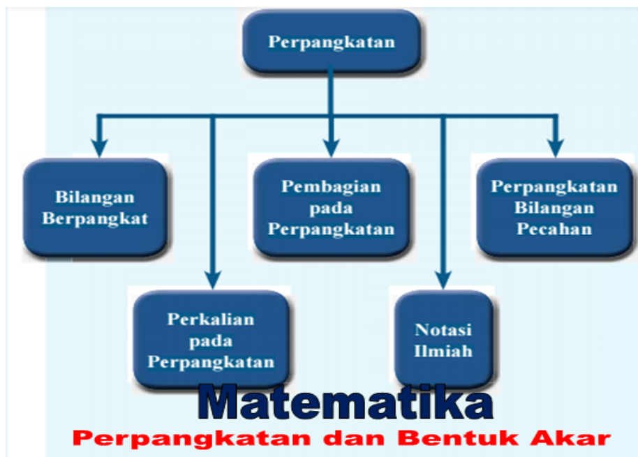
Gambar 1. Peta konsep materi perpangkatan

Pada kegiatan pembelajaran dengan teknik guru kunjung, materi yang dipelajari adalah perpangkatan dan bentuk akar sebagaimana tertera pada peta konsep berikut: