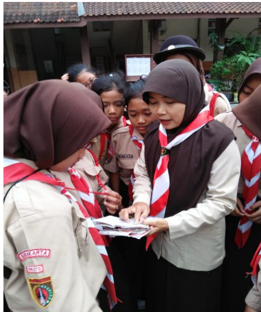
Gambar 2. Kakak Pembina sedang memberikan instruksi.

Lalu siswa juga harus antri tidak hanya di saat pelaksanaan kegiatan ujinya, tetapi juga di saat penandatanganan di kolom nomor yang terdapat pada buku SKU Penggalang. Karena sebagai Pembina, di saat selesai pelaksanaan uji dan siswa masih ada kesalahan ataupun hal yang perlu dikoreksi, maka harus diberitahukan oleh Pembina pramuka secara langsung pada siswa. Agar siswa lulus uji SKU dengan pemahaman yang baik dan benar.