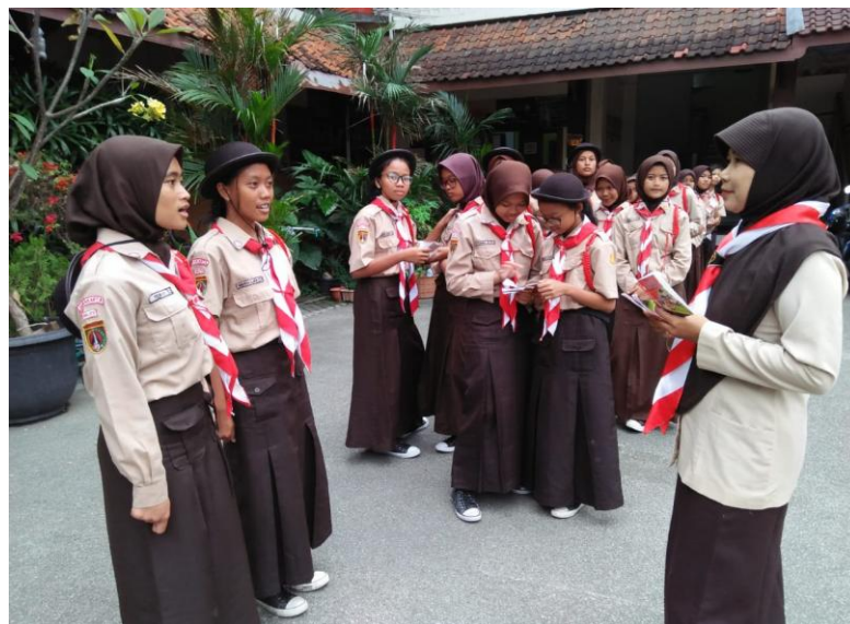
Gambar 1. Siswa yang harus antri saat belum menggunakan Vlog.

Sebagai pembina pramuka yang baik dan benar, harus selalu hadir mendampingi kegiatan pramuka. Karena dalam kepramukaan itu berlaku sistem satuan terpisah, dimana para siswa putri ( penggalang Pi ) harus didampingi dan dibina oleh pembina putri, sedangkan siswa putra ( penggalang Pa ) harus didampingi dan dibina oleh pembina putra.