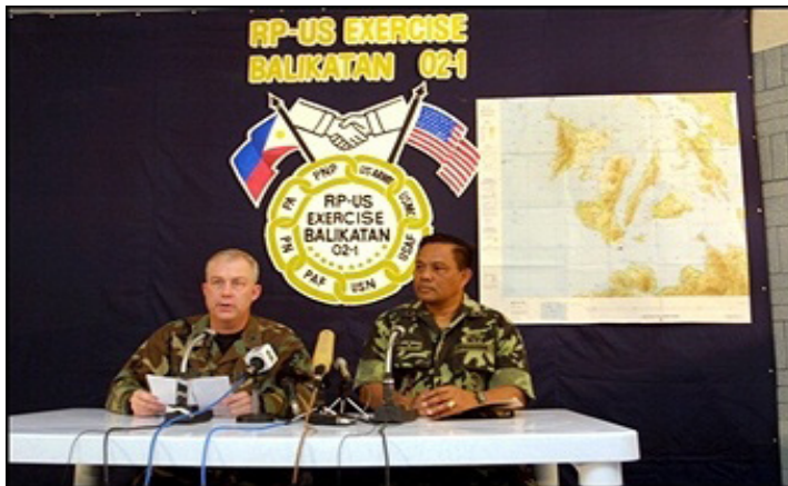
Gambar 3: Operation Balikatan 02-1, 2002 In Zamboanga, Philippines