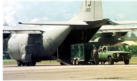
Gambar 2: Pesawat kargo C-130 AS