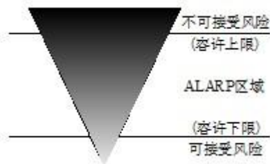
图 1 ALARP 原则

该原则通过容许上限和容许下限将风险划分为 3 个区域(如图 1 所示)：风险水平超过容许上限即为不可接受风险，除特殊情况外该风险无论如何都不能被接受，相关活动必须停止；风险水平低于容许下限则风险被认为是可以接受的，无需采取风险控制措施；风险水平处于容许上限和容许下限之间时，可采取合理可行的控制措施尽可能的来降低风险 16, 17 。