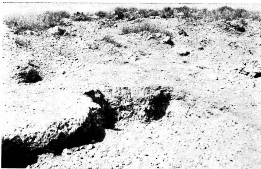
Plaat IV: Lek in brakgrond.