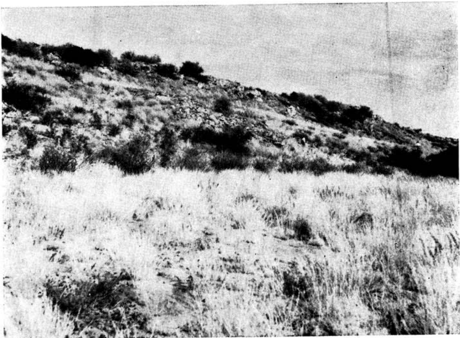
Plaat 1: Kalkbanke (30—40 vt. hoog) linkeroewer Nossobrivier.

Veral in die suidoostelike gebied kom daar onder die sand, sandsteen of kalkbank, heelwat van die Kalaharimergels voor. Hulle bestaan grotendeels uit pienk of rooi kalkhoudende klei.