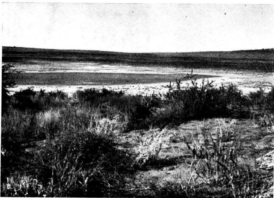
Plaat III: Pan in duineveld.

Die grond uit die pan is redelik van klei dwarsdeur die profiel en van slik in die bogrond voorsien. Die interne dreineringsweens die fyn, ontvlokke materiaal is besonder swak (Tabel 5).