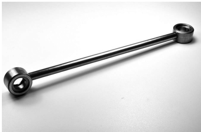
Bild 2. Lötbaugruppe aus Stahl mit Cu Sn 6 gelötet

Für die Automobilindustrie sollten, siehe Bild 2, Lenkungsteile, die an beiden Rohrenden jeweils ein Ringstück besitzen, gelötet werden.