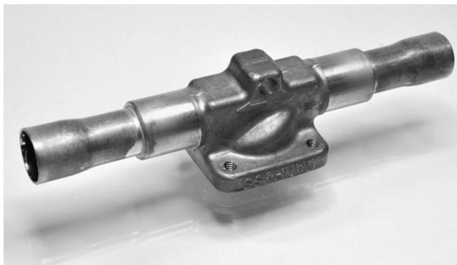
Bild 1. Ventilkörper aus Messing mit Rohren aus Kupfer, gelötet mit LAg55Sn

Die nachstehende Baugruppe, bestehend aus einem Messingventilkörper mit 2,5% Blei und 2 Stück Kupferrohren, sollte flussmittelfrei mit LAg55Sn gelötet werden, Bild 1.