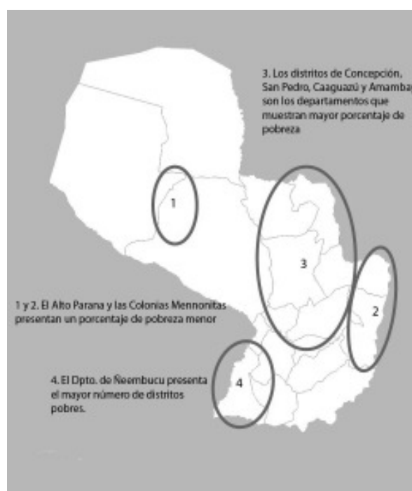
Figura 2: Paraguay Pobreza y Desigualdad de Ingresos a Nivel Distrital