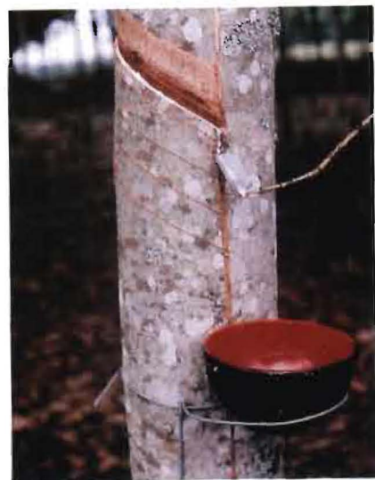
FIGURA 4. Disposición del trazado y del corte para la sangría. Equipamiento en el árbol para la recolección del Látex