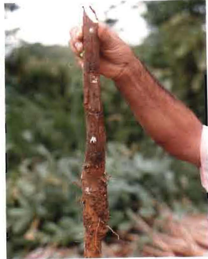
FIGURA 2. Stump para establecimiento de la plantación en el sitio definitivo ó para instalar el jardín clonal a partir de materiales seleccionados.