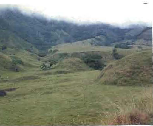
FIGURA 1. Aspecto general de la zona del valle del río Porco que comprende el área estudiada.