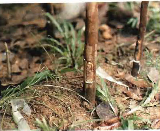
FIGURA 3. Fase de prendimiento de una yema proveniente del jardín clonal, en un patrón, mediante el sistema de injerto de yema dormida o ventana ó lengüeta. Da origen al stump como material de siembra.