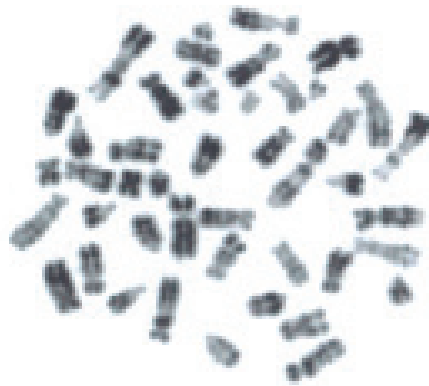
Figura 1. Mitosis 46, XY en estadio III replicativo de un macho S. leucopus la cual sirvió de base para la elaboración del cariotipo y una de las usadas como referente para la construcción del idiograma.

Elaboración Cariotipo. Los extendidos cromosómicos se analizaron en un microscopio ZAISS® Primo Star con objetivo de inmersión 100X. Para la determinación del número cromosómico se evaluaron 50 mitosis de cada ejemplar muestreado; se seleccionaron 10 mitosis en estadio III replicativo para la elaboración del cariotipo y del idiograma propuesto, así como también para las mediciones respectivas (Figura 1).