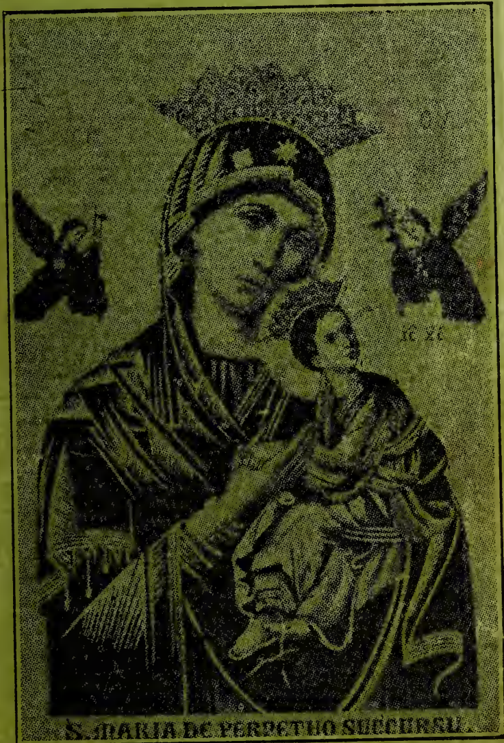
S. MARIA DE PERPETUO SECCURELL.